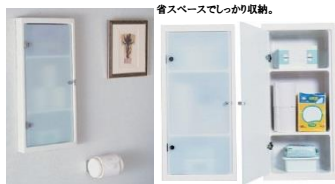
省スペースでしっかり収納。