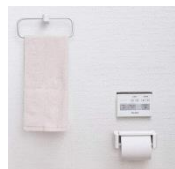
ペーパーホルダー